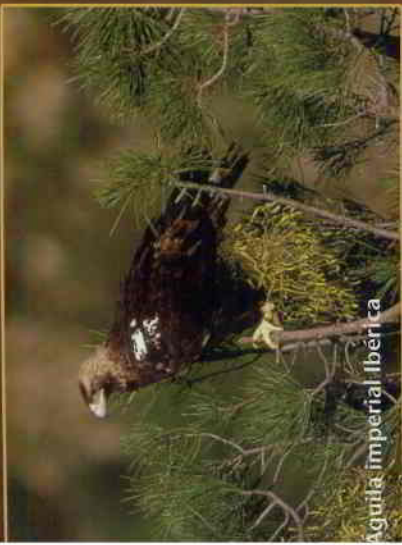
Aguila imperial ibérica

El extenso y diverso territorio de Castilla y León es un lugar privilegiado para la observación de aves en la península Ibérica. Desde las extensas llanuras del interior a las altas cumbres de sus montañas, se dan cita infinidad de ambientes con una rica y variada fauna aviar. Hay registros de 361 especies de aves, 218 consideradas como nidificantes de las 266